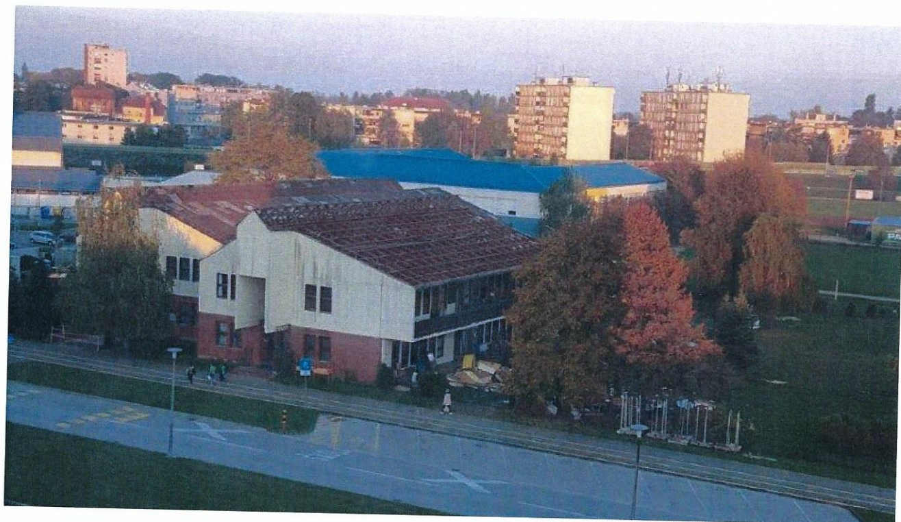
Vrtić Grabrik, od 1983. do 2018.g.